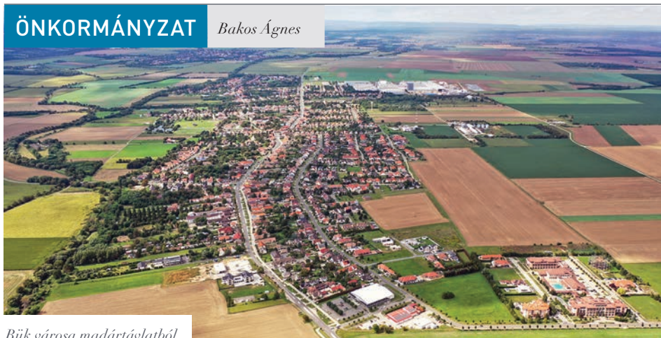
Bük városa madártávlatból

Mintegy 11,1 milliárd forint Bük város 2024-es költségvetésének főösszege, ami a víziközmű-beruházás támogatása okán ilyen magas. Elfogadták a képviselők a bevételi és a kiadási számokat a februári munkaterv szerinti ülésen.