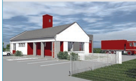
A látványterv egyik képe a leendő büki tűzoltószertárról

Újabb lépéssel közelebb a büki tűzoltóság. A tavaly megalakult tűzoltó egyesület számára szertár épül Bük határában.