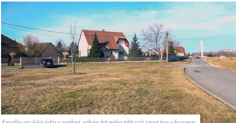
Egyelőre egy kőris lakja a területet, néhány hét múlva több száz társat kap a facsete

nem fenyeget, azonban a koncentrált növénytársulás komoly mennyiségű, éves szinten több tonna port lesz képes megkötni, miközben nem mellékes az sem, hogy újabb turisztikai attrakcióval gazdagodik a város.