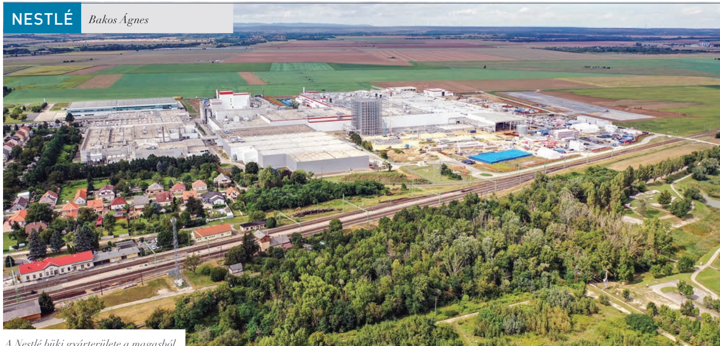
A Nestlé büki gyárterülete a magasból

A Nestlé Hungária egy újabb, 55 milliárd forint értékű beruházást jelentett be büki PURINA gyárának fejlesztésére. Az új gyáregység üzembe helyezése zárja majd le azt a 2020-ban megkezdett ötéves fejlesztési ciklust, amivel a vállalat 300 milliárd forintnyi beruházást hajtott végre Bükön.