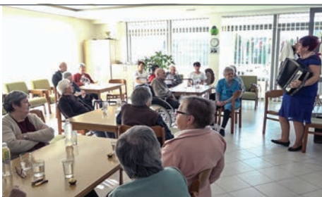
Harmonikaszótól volt hangos a délelőtt