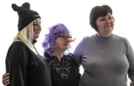
Jelmezes lett az idősotthon farsangi összejövetele

– Remélem, ahogy az elmúlt években, idén is minél több összejövetelt tudunk megvalósítani, az évben az első mi is