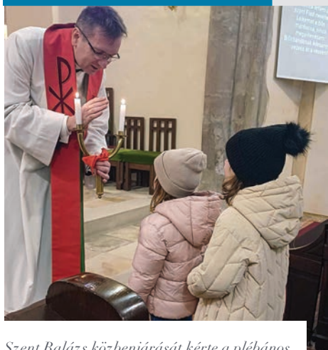
Szent Balázs közbenjárását kérte a plébános

A Katolikus Egyház minden évben február 3-án emlékezik meg az örmény származású szentről, a kisázsiai Szebaszte püspöktől. A szentmisében ezen a napon hozzá is fohászkodunk, áldását kérjük, hogy „őrizzen meg minket a torokbajtól és minden más betegségtől.”