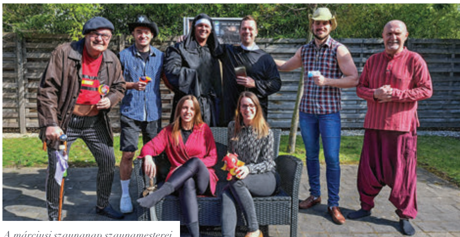
A márciusi szaunanap szaunamesterei

szaunaprogrammal készülnek: lesz szaunázók éjszakája (6-án), valamint szaunanap (20-án). A rendezvényekkel párhuzamosan pedig „munka-terület” lesz a szaunavilág, ugyanis felújítás kezdődik. Áprilisban újulnak meg szaunakabinok, méghozzá úgy, hogy elsősorban éjszakánként dolgoznak a szakemberek a renováláson, így néhány nap lezárással járnak csak a munkálatok.