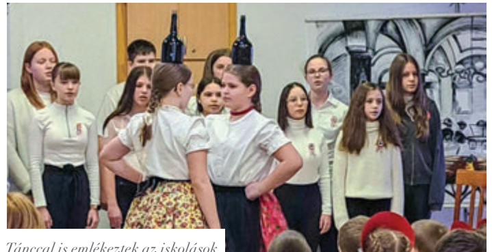
Táncal is emlékeztek az iskolások