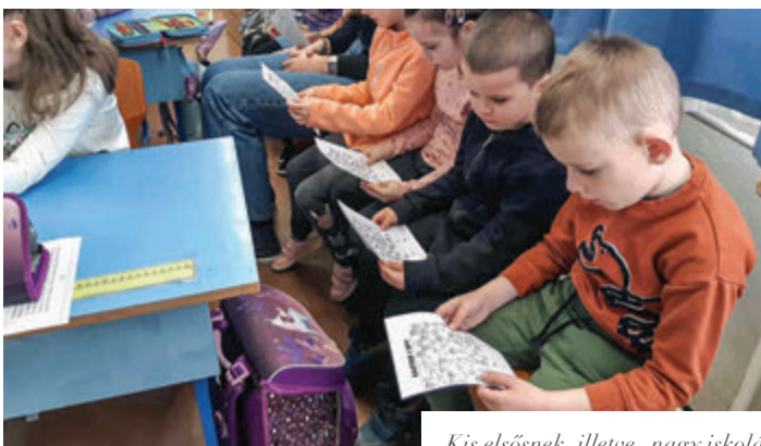
Kis elsősnek, illetve „nagy iskolásnak” érezhették magukat az ovisok

meg. A tanóra végén szívesen rajzoltak a kicsik a táblára krétával. Volt, aki a jelét, volt, aki a nevét írta fel. A negyedikese apró ajándékkal kedveskedtek az óvodásoknak. A program zárásaként az iskola épületében sétáltak egyet a leendő iskolások. Bízunk benne, jól érezték magukat nálunk a kis nebulók és várják az újabb programot. Áprilisban tavaszi foglalkozásra várják őket az iskolába a leendő tanító nénik. Április 18-án és 19-én pedig az iskolai beíratás lesz.