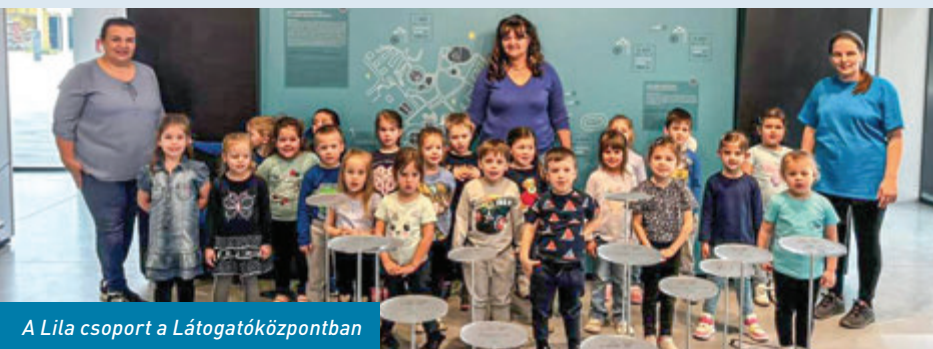
A Lila csoport a Látogatóközpontban

A víz világnapjához, március 22-éhez kapcsoló tevékenységeinkkel célunk, a gyermekek ismereteinek bővítése, az élményszerzés és az, hogy felhívjuk gyermekeink figyelmét a víz jelentőségére, a takarékos vízhasználatra, élővizeink és azok élővilágának védelmére.