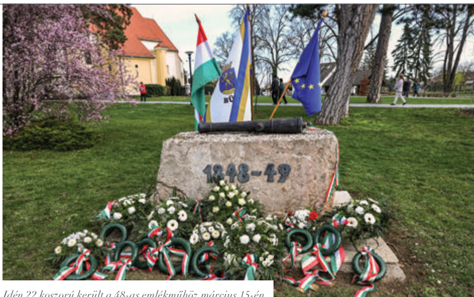
Idén 22 koszorú került a 48-as emlékműhöz március 15-én

Tavaly ünnepeltük az 1848-as polgári forradalmunk 175. évfordulóját. Petőfi Sándor születése 200. évfordulójához kapcsolódó emlékévkben a vártnál kevesebb szó esett 1848-ról. A 150. évforduló évében, az immár 26 éve indult Büki Újság 1. számában kezdett cikksorozatomban végigtekintettem a hősi időszak büki (akkor még három büki) történéseit. A leírtak most is helytállóak, mindössze néhány apró kiegészítéssel bővítettem azokat az újabb kutatások alapján.