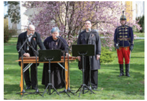
A Keke-ri-Keltike megzenésített Petőfi-verseket adott elő

az emberek csak várják, de érte nem tesznek semmit. A szabadság földi kincs, amit mindig el akarnak rabolni hataloméhes emberek vagy csoportok. A szabadságot óvni kell, mint a víz tisztaságát. A szabadságért fel kell ébrednie a népnek, talpra kell állnia – ha másként nem megy, akkor úgy, mint a márciusi ifjaink – hallhatták az emlékezők Simon Rékától. – Férfiak és nők, a mindennapok emberei! Őrizzük az 1848-49-es szabadságharc hőseinek értékeit, és éljük a hazaszeretetnek olyan példáját a gyermekeink és fiataljaink elé, amely otthonná, valódi honná teszi anyaföldünket és népünket a számukra, és a jövő nemzedékek számára – zárta gondolatait.