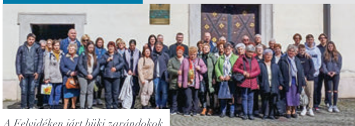
A Felvidéken járt büki zarándokok

Március 23-án, szombaton (a történelmi) Magyarország első Mária-kegyhelyét kereste fel zarándokcsoportunk a felvidéki Máriavölgyben.