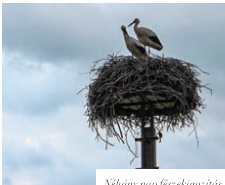
Néhány nap fészkekigazítás után a hivatal melletti gólyapár

is elsősorban a büki horgásztó. Mindössze öt nappal a megérkezésük után már a családalapításba is belefogott a gólyapár. Tavaly sikeres költés helyszíne volt a városháza melletti fészkek, hiszen három gólyafiókát neveltek a szülők az egyébként tiszta és takaros gólyaotthonban, amely veszélyes műanyagoktól mentes lakhelyet biztosít a madaraknak.