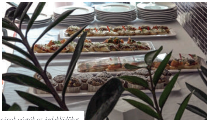
Gyógytorna és egészséges finomságok várták az érdeklődőket