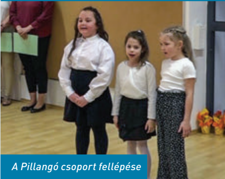
A Pillangó csoport fellépése

Óvodánk 1954. március 1-jén nyitotta meg kapuit, biztosítva a gyermekek számára a szeretetteljes, biztonságos, vidám, élményekben gazdag mindennapokat.