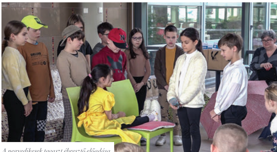
A negyedikesek tavaszt ébresztő előadása