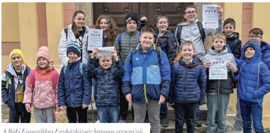
A Büki Evangélikus Egyházközség hittanos versenyzői