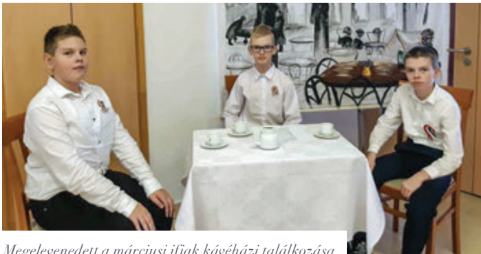
Megelevenedett a márciusi ifjak kávéházi találkozása

dagép lefoglalásának is tanúi lehetünk. A Nemzeti Múzeum lépcsőjén elhangzott a Nemzeti dal és a refrént, mint talán ott akkor, együtt zengte az ifjakkal az iskola közössége. Felemelő volt hallgatni az erőteljes hangot: „Esküszünk, esküszünk, hogy rabok tovább nem leszünk!” A költő azonban nemcsak a versben, hanem a dalban is közöttünk volt, és emlékeztetett ama dicső eseményekre. Méltó módon emlékezett iskolánk közössége a napra, mely nagyszerű és dicső volt. Majd koszorúzással tisztelegtek a diákönkormányzat tagjai a templomparkban a 48-as emlékműnél.