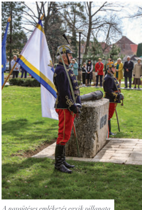
A napsütéses emlékezés egyik pillanata

talpra ugrás és az a szabadság iránti vágy, amelyről ezek a régen élt emberek írtak, beszéltek, és amit ők tettek. Népünk meghatározó nagyjai, hősei ők, akiknek a szavait és tetteit évről évre felidézünk, és valami szentségbe hajló tisztelettel és szeretettel ünnepeljük. Az 1848-as forradalom a szabadság leckéje ma is minden magyarnak, aki nem alszik abban a mély, mozdulatban, halálhoz közeli-rokon álomban – fogalmazott a lelkész. – A népek szabadsága nem hull harmatként ránk. Nem olyan áldás, ami akkor is megvalósulhat, ha