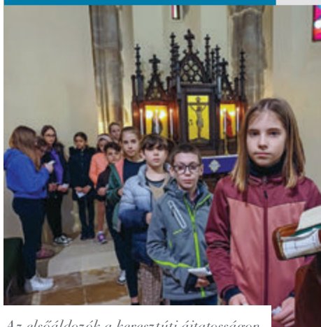
Az elsőáldozók a keresztúti ájtatosságon

„Kérek Jézus, add, hogy mindig segítsék azokon az embereken, akik segítségre szorúlnak! Add, hogy meglássam azokat az embereket, akik szenvednek valamiben és segítsék rajtuk akkor is, ha csak egy jó szót tudok mondani.”