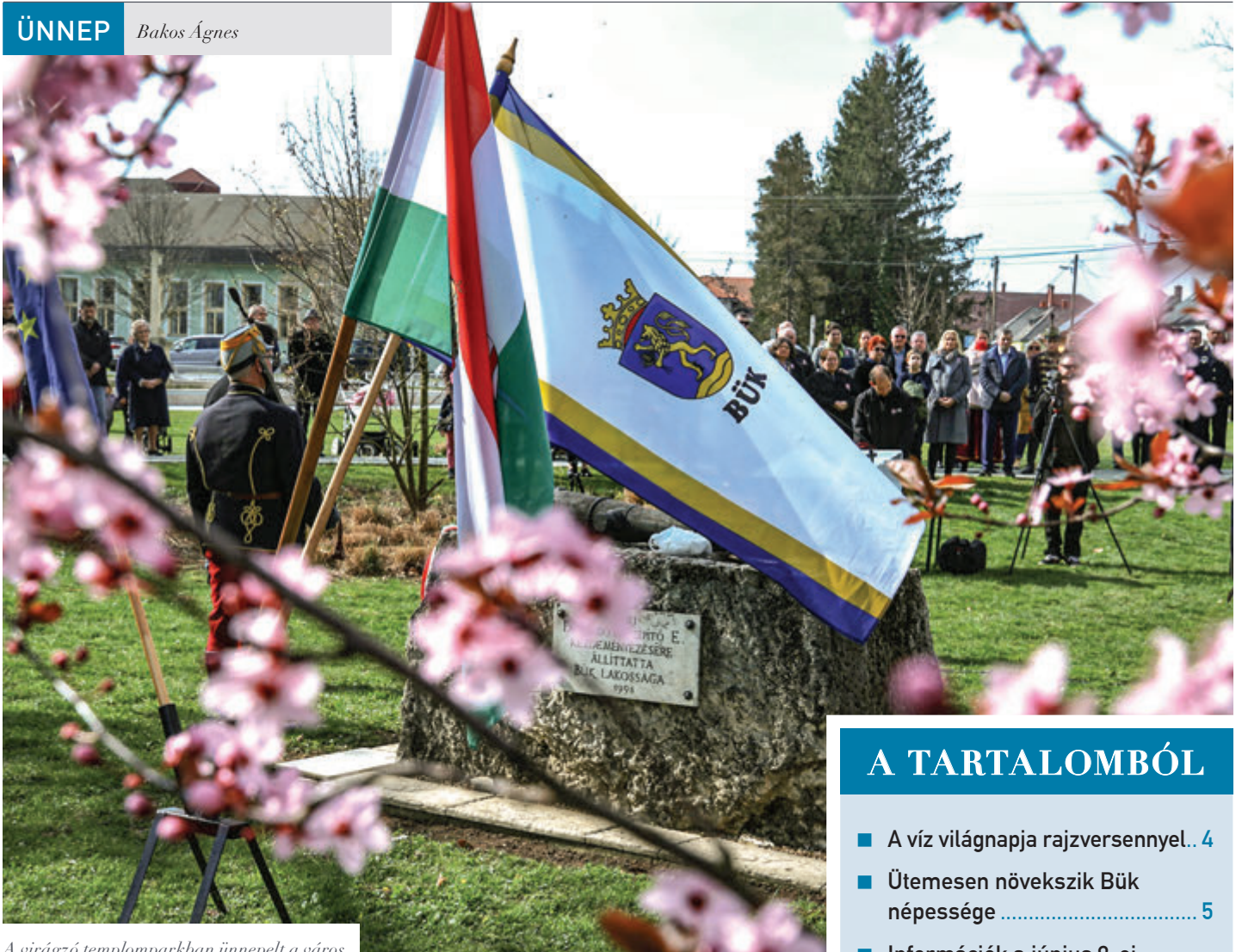
A virágzó templomparkban ünnepelt a város

Helyi csoportok közreműködésével emlékezett Bük az 1848/49-es forradalom és szabadságharc kitörésének évfordulóján március 15-én.